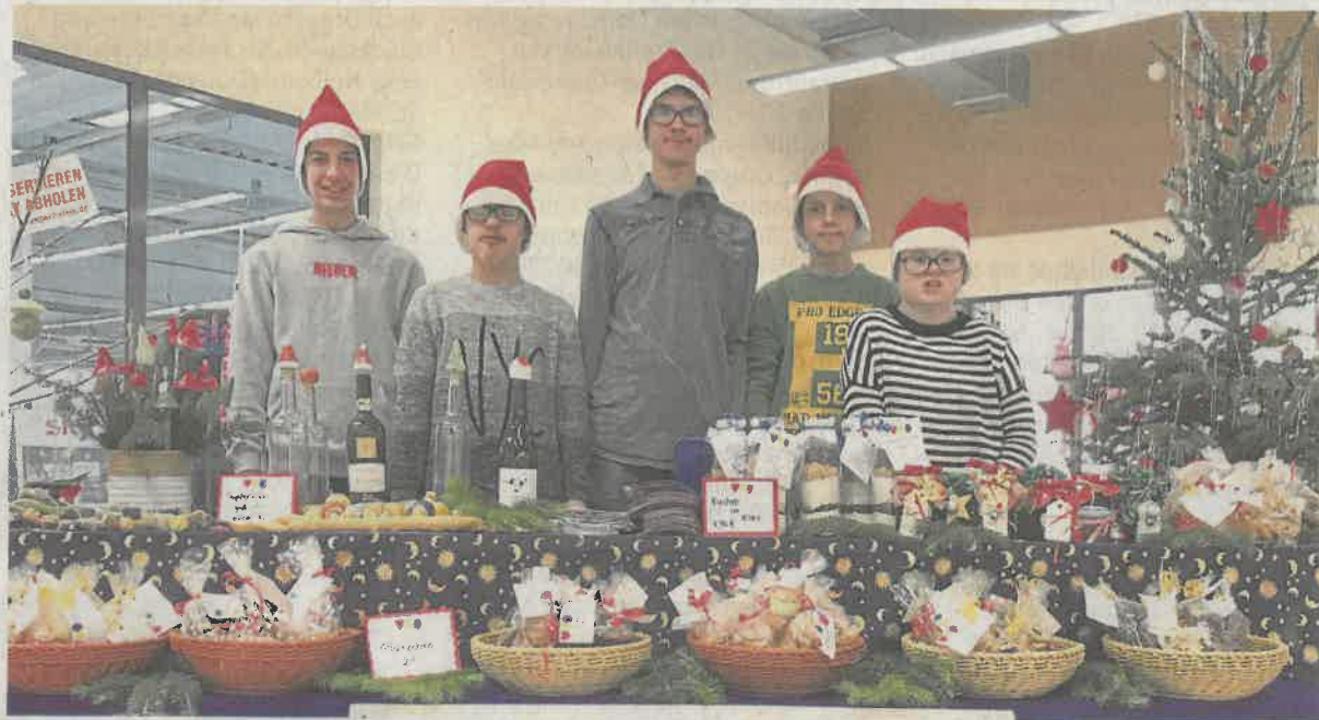
Die Oberstufenschüler der Don-Bosco-Schule verkaufen ihre selbst gebackenen Weihnachtsplätzchen.